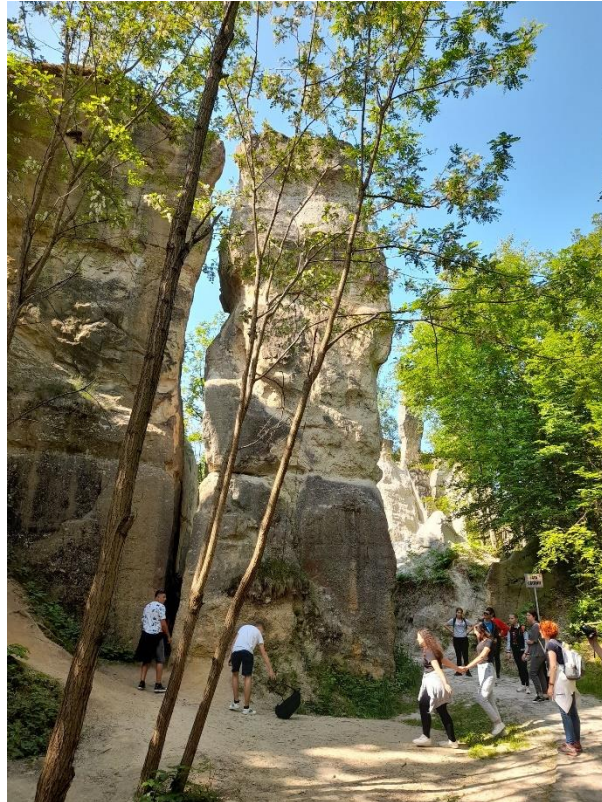
Zsibó – botanikus kert